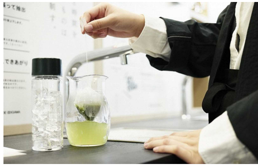
<緑茶 B.I.Y スタンド>